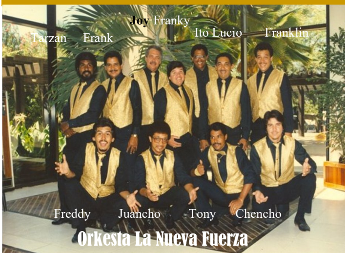
Orkesta La Nueva Fuerza